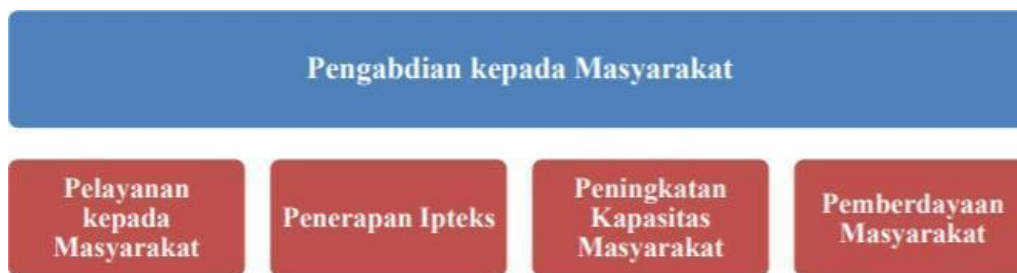
Gambar 3.1 Bentuk PKM

PKM yang dilaksanakan oleh seluruh civitas akademika Poltekbang Palembang merupakan kegiatan dalam menerapkan, mengamalkan, dan membudayakan ilmu pengetahuan dan teknologi, guna memajukan kesejahteraan umum dan mencerdaskan kehidupan bangsa. Adapun bentuk PKM yang dilaksanakan adalah sebagai berikut: